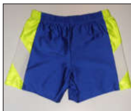
Cuissard mi-long : 25€