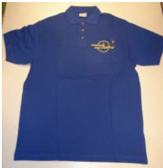
Polo : 25€