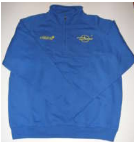
Sweat homme (bleu) : 25€